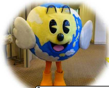
空の日キャラクター 「くにまる」

空の日キャラクター「くにまる」のほか、苫小牧市キャラクター「とまチョップ」や千歳市キャラクター「さもん君」も参加しますよ♪(雨天時、キャラクターは不参加になる場合があります。)